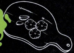
Planche charcuterie À PARTAGER 9.90 €